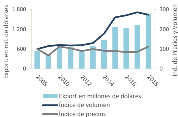
Gráfico N°2 - Exportaciones de celulosa. Valores, Precios y Volúmenes.